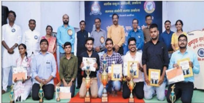
The winners of the competition along with dignitaries.