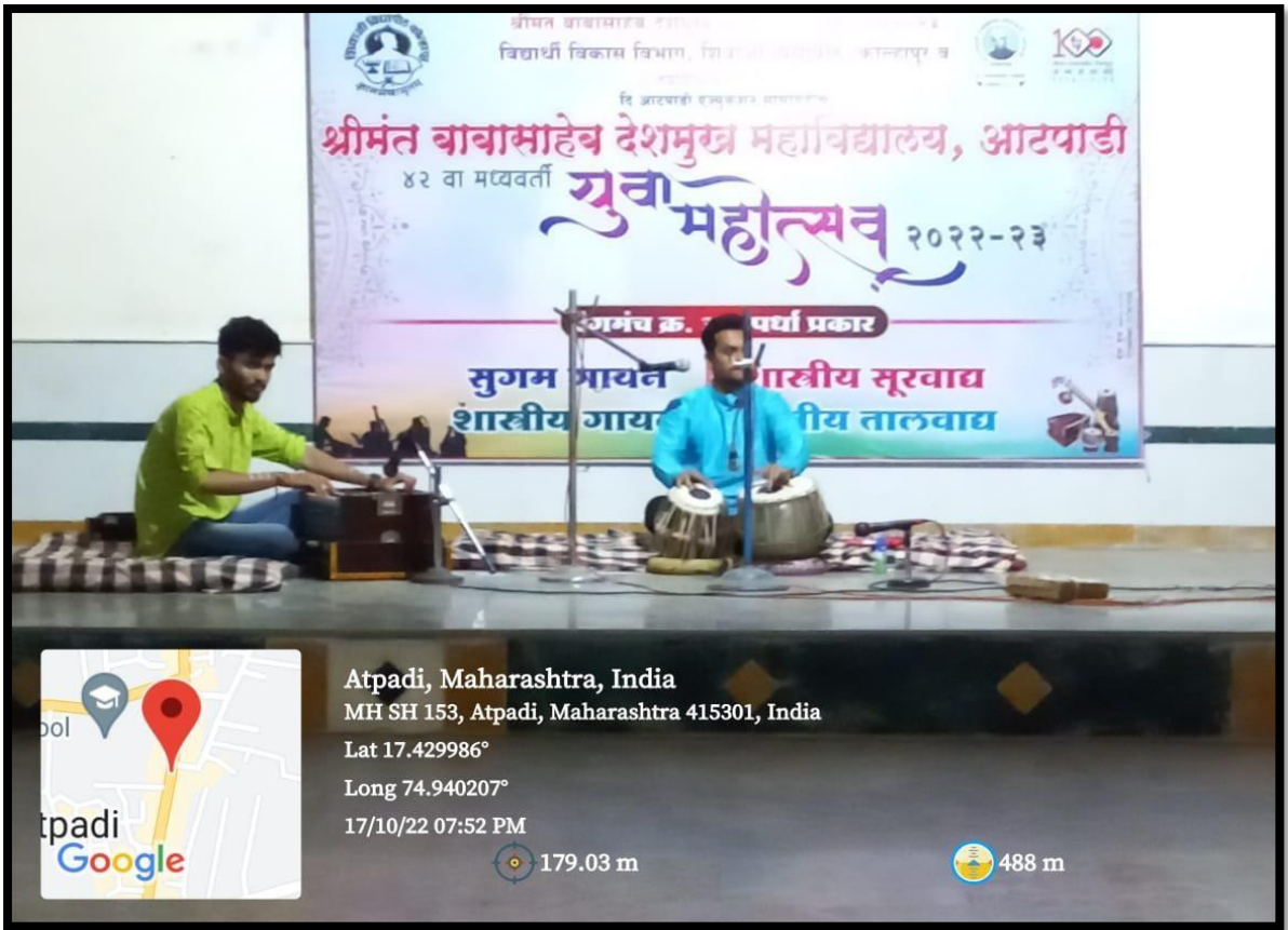
Performing Classical Instrument Play