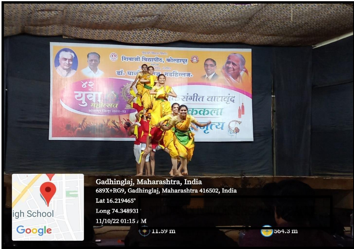
Students Performing Loknritya Dangi