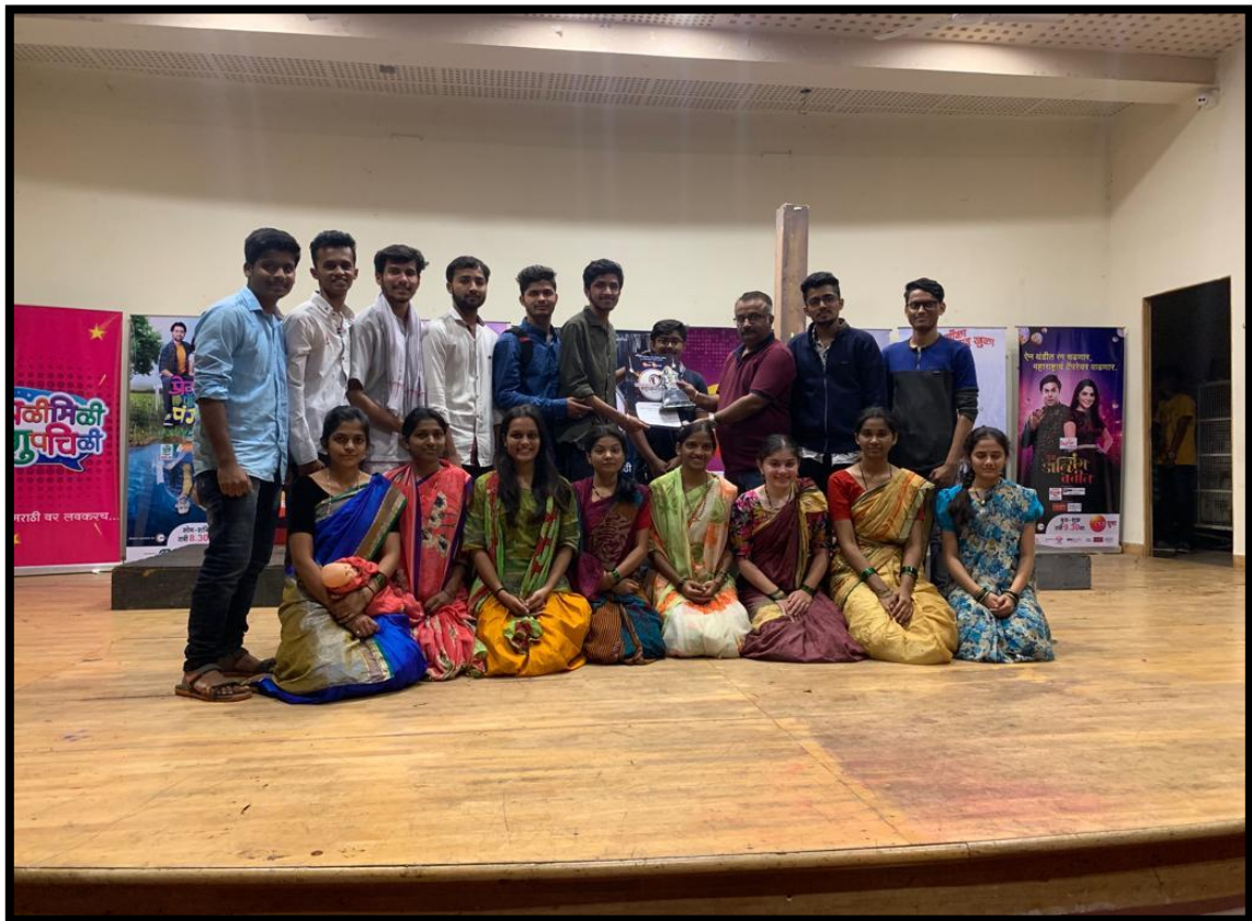
Cultural Team selected for Ahmednagar mahakarandak from Kolhapur zone