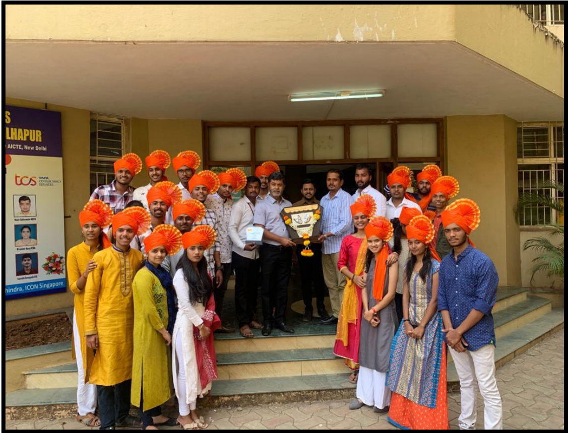
Cultural Team Won Purshottam Karandak