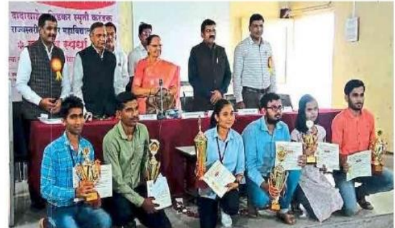
पेठ : येथे झालेल्या दादासाहेब बिडकर स्मृती वक्तृत्व स्पर्धेतील विजेत्यांसह प्राचार्य.