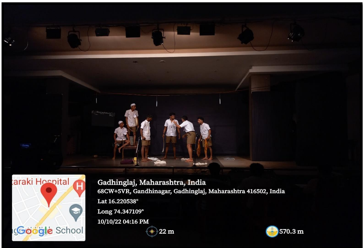
Students Performing Street Play :Sugaymya Bharatbhiyan