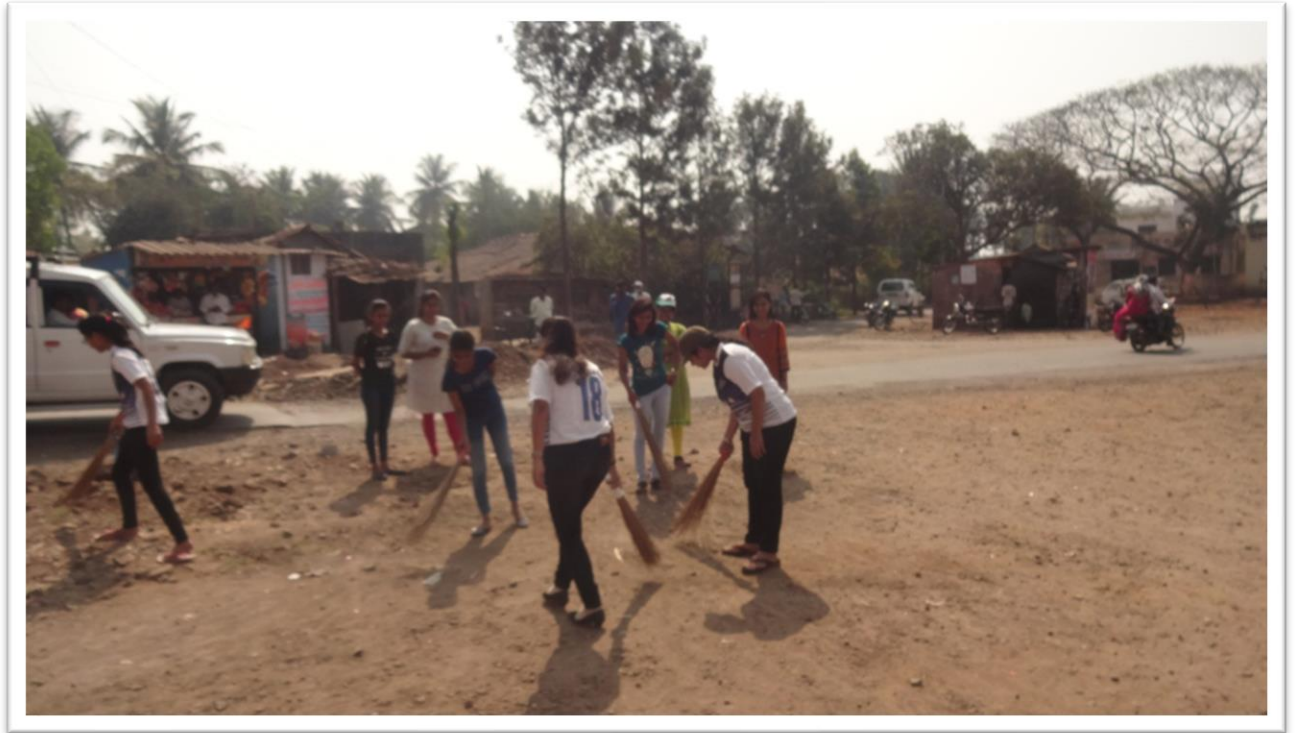
NSS Volunteers cleaning roads at in Mouje Sangaon