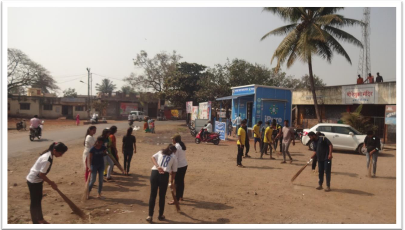
NSS Volunteers –Cleaning Roadside Area.in Mouje Sangaon village.