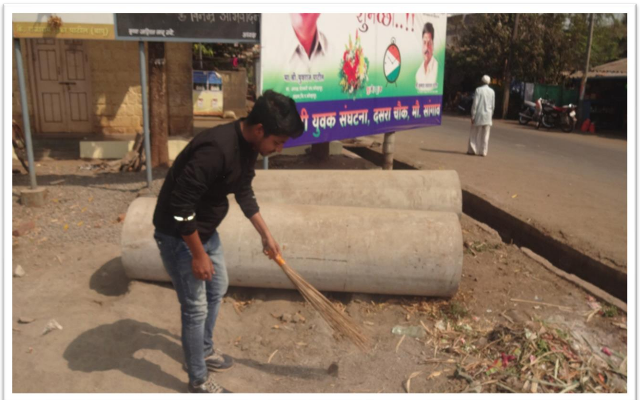
NSS Volunteers –Cleaning Roadside Area.in Mouje Sangaon village.