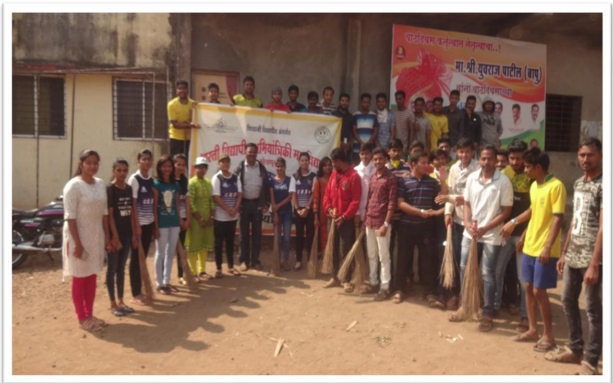
NSS Volunteers Group Photo after road cleanliness activity